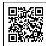
受講申し込み QRコード